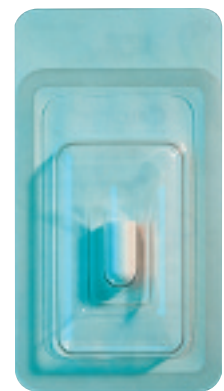
Réf. 0102 Pansement CollaPlug 3/8 po x 3/4 po (1,0 x 1,9 cm)

Une boîte distributrice permet de garder les pansements Zimmer Dental à portée de main durant les opérations.