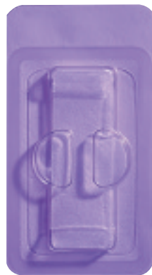
Réf. 0100 Pansement CollaTape 1 po x 3 po (2,5 x 7,5 cm)

Les pansements résorbables au collagène sont livrés dans des emballages coques individuels stériles, dans les configurations suivantes :