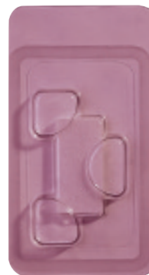
Réf. 0101 Pansement CollaCote 3/4 po x 1 1/2 po (1,9 x 3,8 cm)